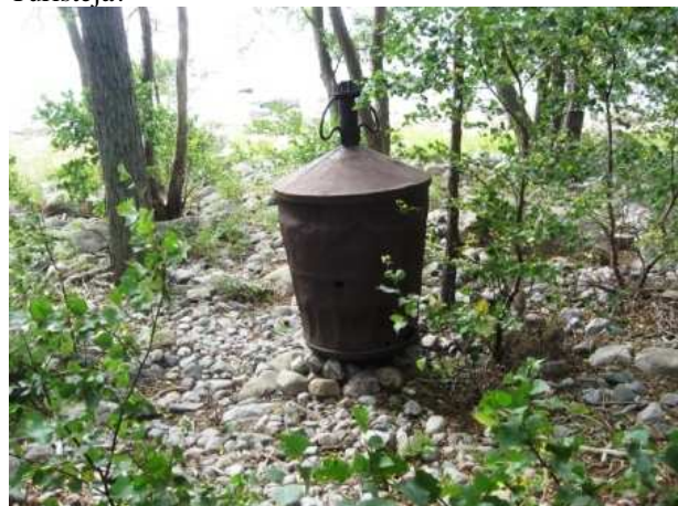
Vanha ruostunut meripoiju.

Tervetuloa mukaan SaunaMafia Team ry:n iloisiin tapahtumiin!