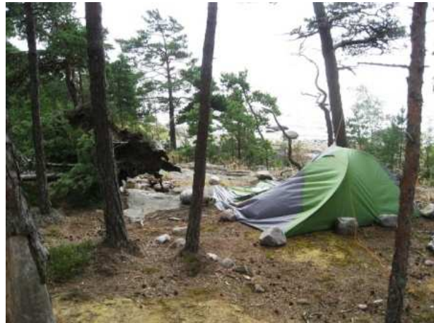
Ja vähemmän kunnossa olevia.