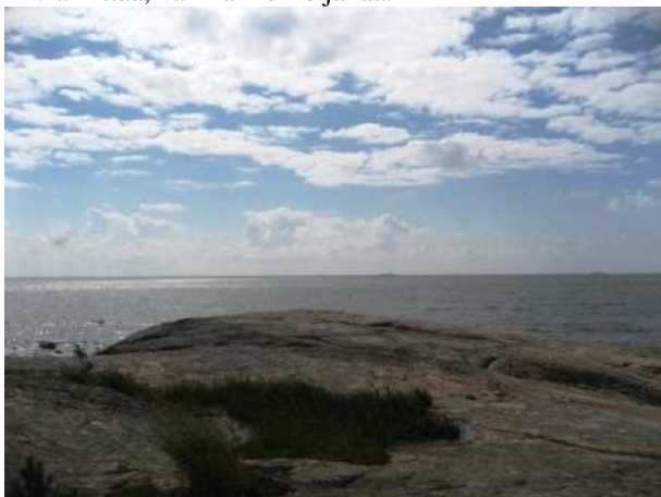
Ilmakin kirkastui ja tuli aivan loistava ulkoilusää. .