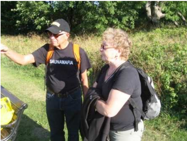
Muka tietä neuvoo tytöille (saaressa?)