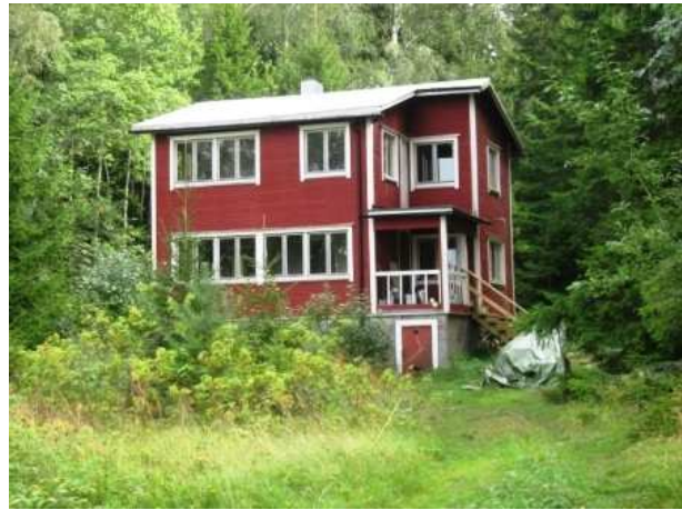
Kaikenlaisia rakennuksia löytyy myös Kaunissaaresta.