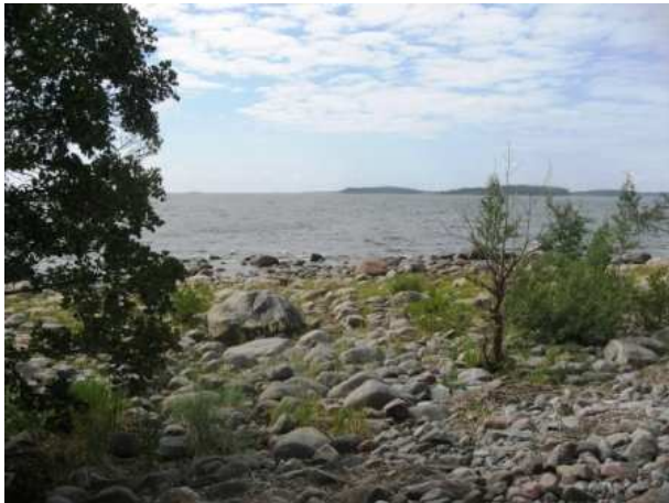
Kiviä riittää, vaikka muille jakaa.