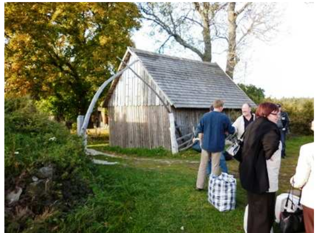
"Mammutin hampaat" pääporttina