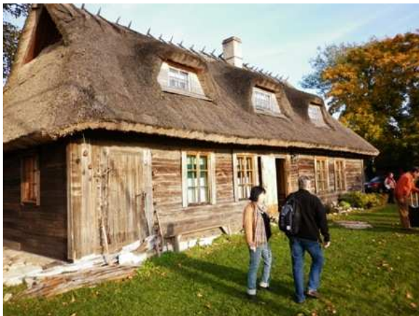
Kuuluisa lepakkoperhe-Lehto (päivällä!)